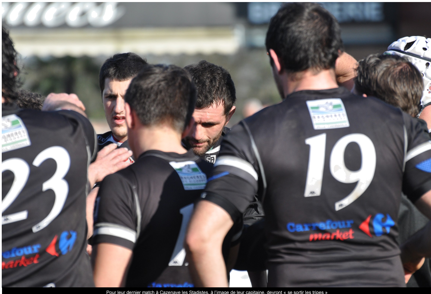
Pour leur dernier match à Cazenave les Stadistes, à l'image de leur capitaine, devront « se sortir les tripes »