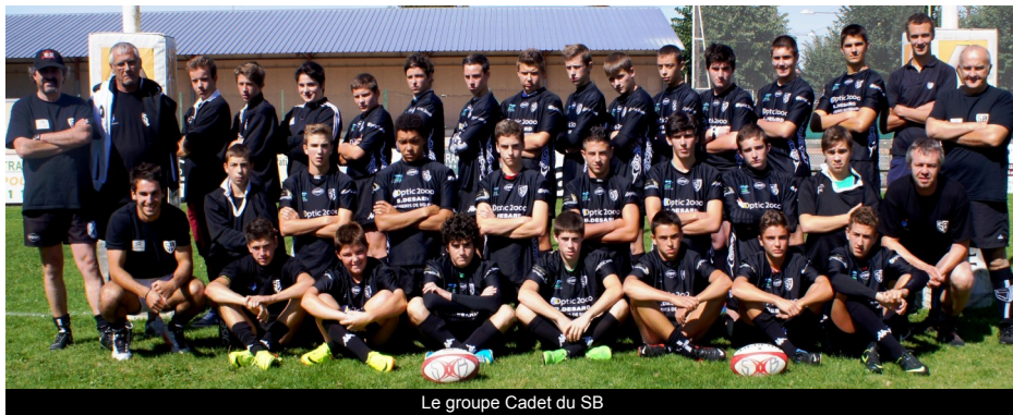
Le groupe Cadet du SB