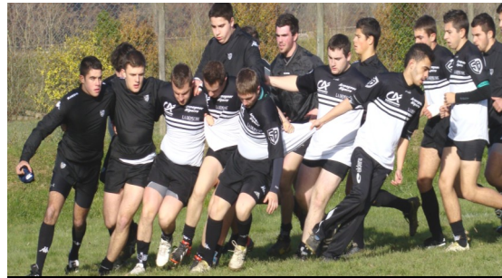
Les Balandrade qualifiés pour la finale 2014 du Challenge Béarn-Bigorre