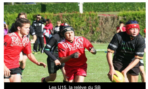
Les U15, la relève du SB

Dans notre prochain numéro, zoom sur les Belascain de Haute Bigorre XV et les cadets Teulière