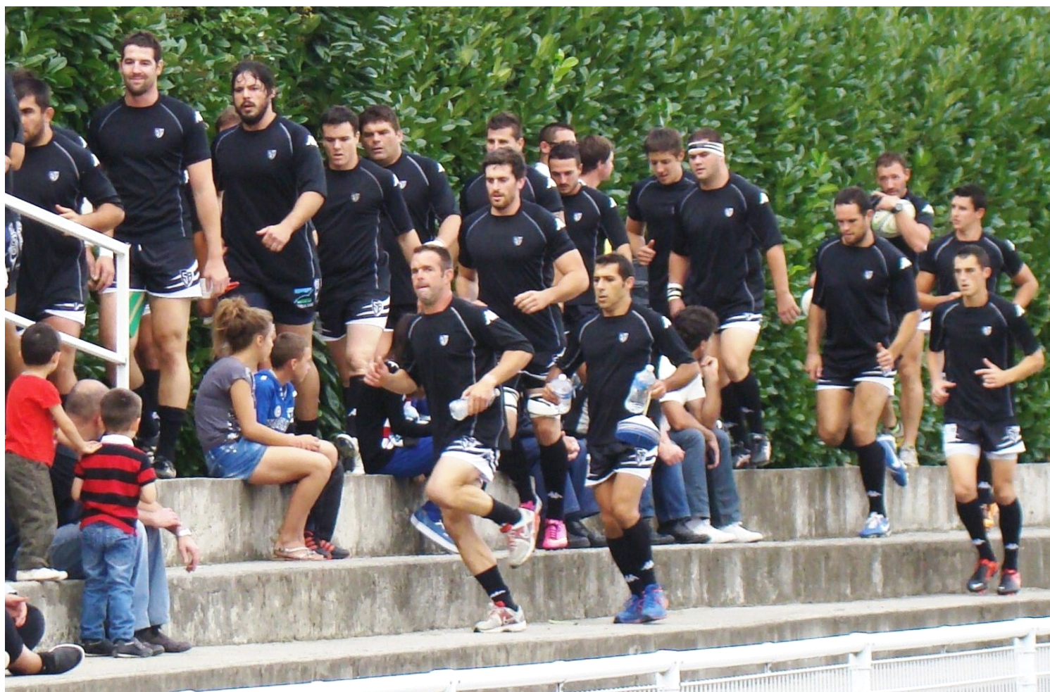
Victoire impérative pour les Noirs face à Lourdes