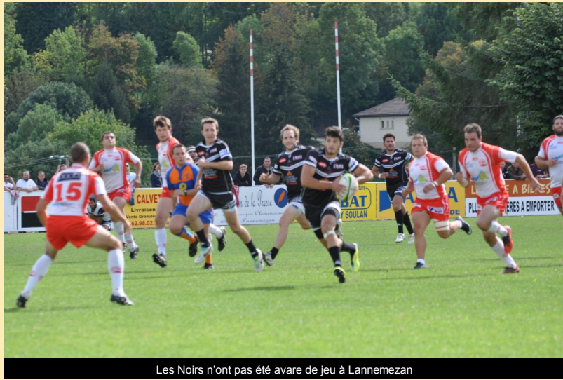
Les Noirs n'ont pas été avare de jeu à Lannemezan