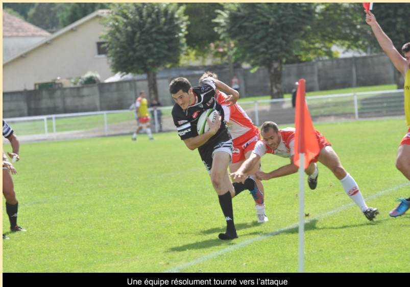
Une équipe résolument tournée vers l'attaque