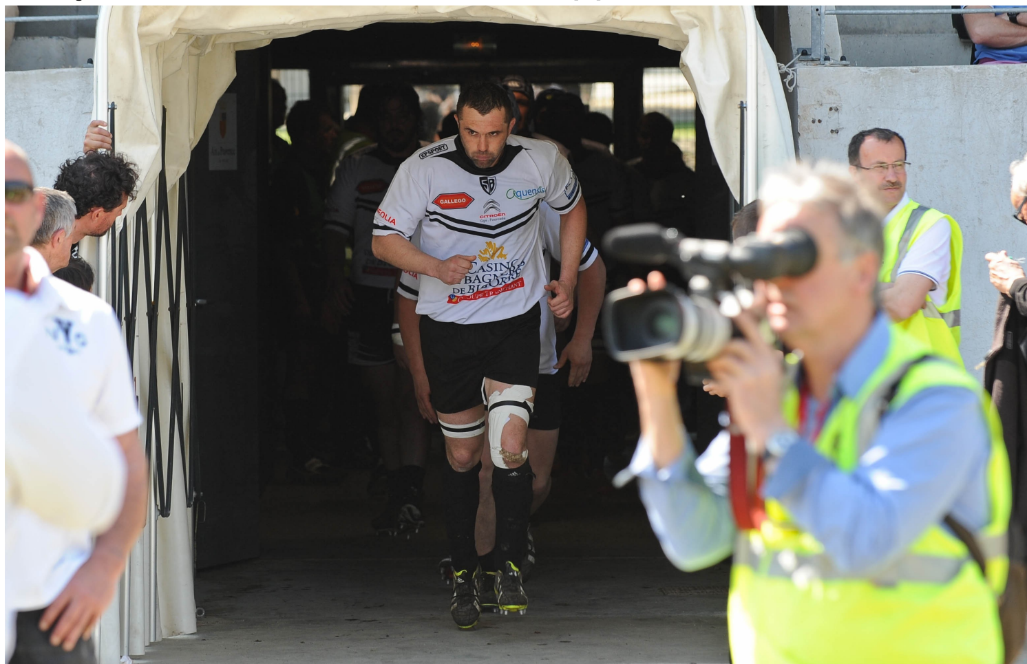
Supporter sans relâche et de bout en bout l'équipe, voilà ce que demandent les joueurs à leur public