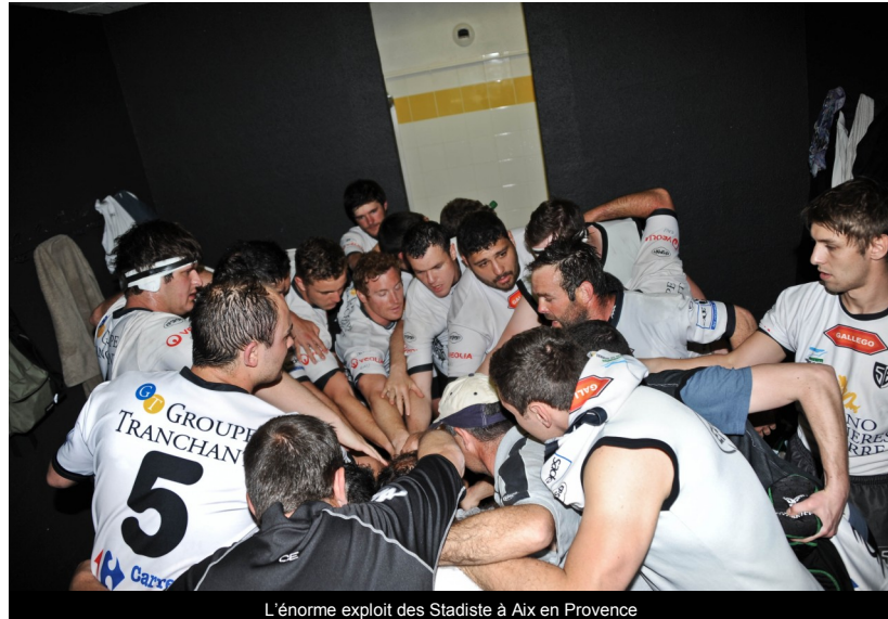
L'énorme exploit des Stadistes à Aix en Provence