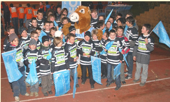
photo prise en compagnie de la mascotte de l'Aviron Pottoka en personne.

L'encadrement de l'EDR Bagnères-Baronnies a fait plaisir aux jeunes pousses du Stade Bagnérais en les accompagnant jusque dans les tribunes de Jean-Dauger pour encourager les Bleus et Blancs de l'Aviron Bayonnais. L'affiche était belle puisque les basques recevaient le Champion de France en titre, Perpignan. L'USAP s'est imposé à Bayonne mais cela n'a pas empêché nos jeunes de ramener en Bigorre leur sac plein de souvenirs. On a chanté et crié à tue-tête pendant toute la soirée avec en prime une