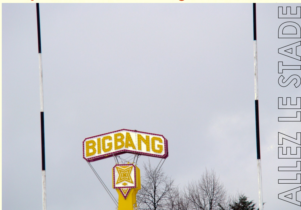
La correction prise lors de la dernière journée de championnat a fait des dégâts

E n avant toute, pas de calculs, les « Noirs » se doivent de montrer qu'ils sont les patrons sur leur terre surtout après la déconvenue, pour ne pas dire la raclée, reçue il y a quinze jours à Castelsarrasin. Les conséquences de cette déroute ne se sont pas faites attendre avec le remplacement des quatre entraîneurs dès le début de la semaine. Il faut croire que le « message » ne passait plus entre eux et les joueurs. L'effet espéré par cette décision radicale sera-t-il suivi de conséquences ? Les stadistes auront-ils eu le temps de digérer ce match cauchemardesque ? On le saura dès le coup d'envoi, face à un des ténors de la poule. Si les chances de qualifications tiennent maintenant du domaine du rêve, celles du maintien sont toujours d'actualité. Mais cela passera par une prestation sans faille des hommes de Patrice Cossou. Mieux que de réagir, il faudra agir aujourd'hui et ce jusqu'à la fin du championnat.