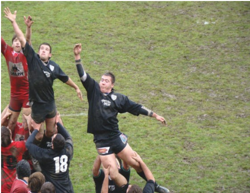
Les Reichel bagnérais se qualifient sans trembler

Afin d'éviter de douloureuses tracasseries administratives et des comptes d'apothicaires, les Reichel devaient remporter leur dernier match de poule à Castelnaudary. Le match se déroulant en lever de rideau de l'équipe première locale montrait toute la fierté et l'honneur des Chauriens de ne rien lâcher. Effectivement, après trente minutes de jeu offensif, les Bagnérais n'étaient récompensés que par une pénalité de Burgès. Arrivait ensuite l'essai de Delmas qui portait le score à 10-0 en faveur des Stadistes. Les locaux ne lâchaient rien et ouvraient le score sur pénalité malgré la domination écrasante du pack "Noir et Blanc". Dans les dernières secondes de la première mi-temps, Ossun marquait enfin un essai sous les poteaux après un superbe mouvement de trente mètres. 17 à 3 pour Bagnères à la pause. Sous la chaleur, la seconde période voyait "camper" les Bagnérais chez l'adversaire donnant l'occasion à Cayrolle de claquer un drop de malin. Le jeu, toujours aussi offensif des Bagnérais dépassait petit à petit les Chauriens. La domination des Reichel était fort logiquement récompensée par deux essais de l'insaisissable Adugard qui ponctuait la fin du match sur un score de 32 à 6 grâce aux transformations réussies par Burgès. Franchement mérité ! Bravo messieurs, mission accomplie. Maintenant rendez-vous le 20 mars pour une cruciale phase finale "Grand-Sud" qualificative pour les 1/8ème du Championnat de France.