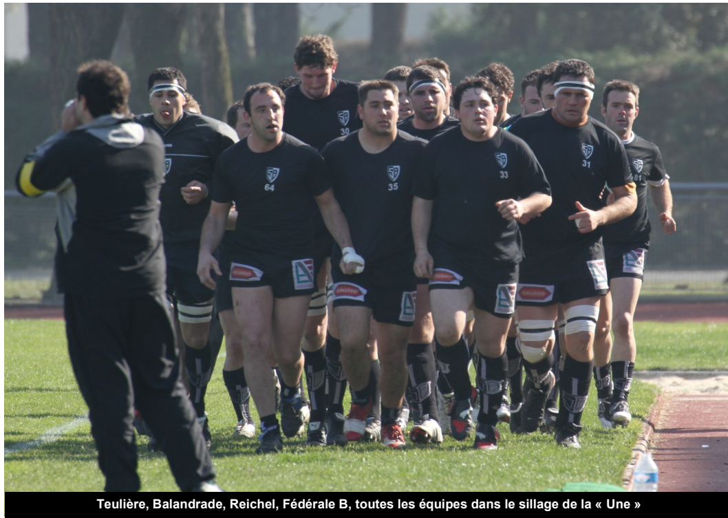
Teulière, Balandrade, Reichel, Fédérale B, toutes les équipes dans le sillage de la « Une »

L'objectif de qualifier toutes les équipes est presque atteint