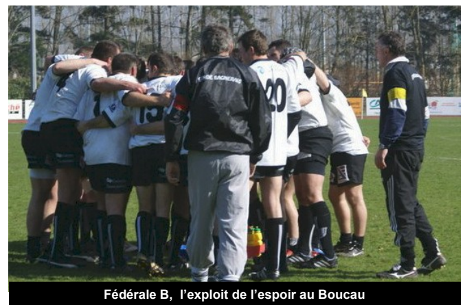
Fédérale B, l'exploit de l'espoir au Boucau