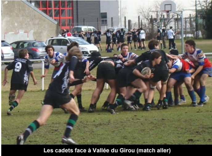
Les cadets face à Vallée du Girou (match aller)