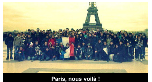
Paris, nous voilà !