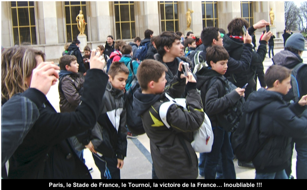
Paris, le Stade de France, le Tournoi, la victoire de la France... Inoubliable !!!

Ce samedi 5 février restera dans toutes les mémoires des 74 enfants accompagnés de 16 éducateurs de l'École de Rugby de l'Entente Bagnères-Baronnies. Grâce à la générosité de la FFR, 90 personnes ont pu se rendre au Stade de France pour assister au match d'ouverture de