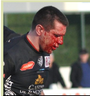
Cossou visage piétiné à Hagetmau