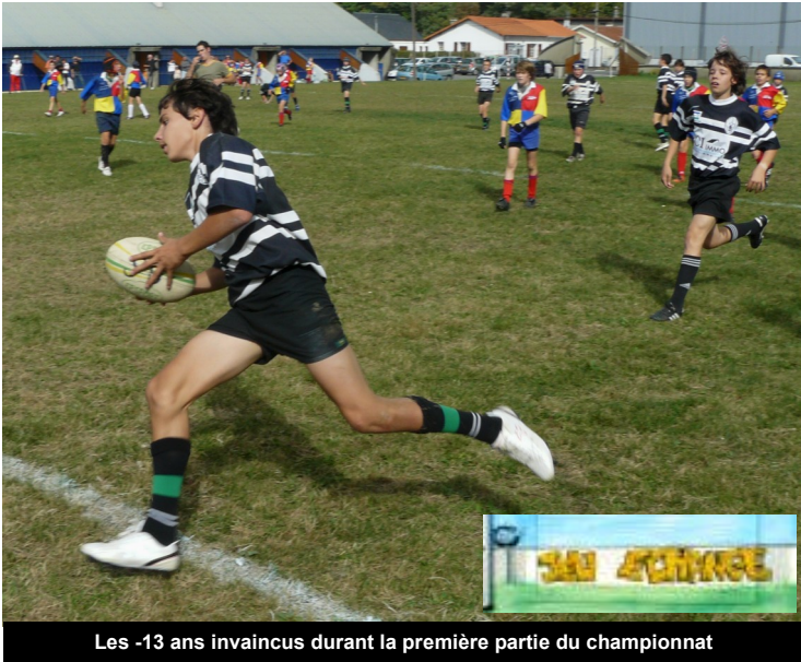
Les -13 ans invaincus durant la première partie du championnat