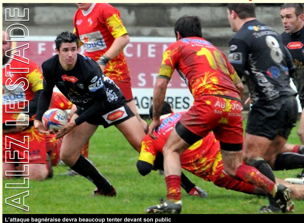
L'attaque bagnéraise devra beaucoup tenter devant son public

P lus que trois matchs avant la fin de la phase de poule qui s'achèvera à Marcel Cazenave face à Nafarroa le 9 mai prochain. Entre temps il faudra se déplacer à Blagnac. Aujourd'hui encore la pression risque de peser sur les épaules des Stadistes pour ce match que l'on peut qualifier de match piège par excellence. Comment les bagnérais vont-ils se comporter après leur performance à Hendaye ? C'est certainement avec beaucoup de détermination et d'engagement que l'équipe devra aborder cette rencontre décisive pour le maintien, si on ne veut pas jouer toute une saison sur le dernier match, d'autant plus que Nafarroa sera peut être dans cette situation. Alors messieurs les bagnérais, faites le nécessaire cet après midi, tout comme vous, le public, qui devrez supporter sans relâche votre équipe durant toute la rencontre. On sait qu'on pourra toujours y compter ... C'est vous le seizième homme. Allez le Stade !