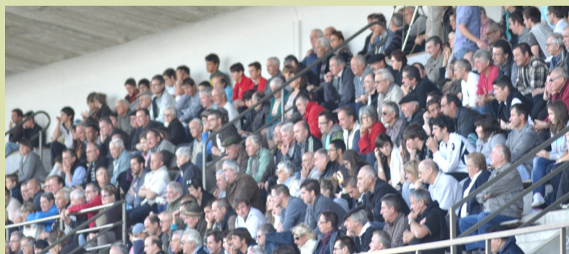
Bagnères a déjà et aura encore un public en 2012

toutes les infos, les photos, les commentaires sur www.stadebagnerais.com