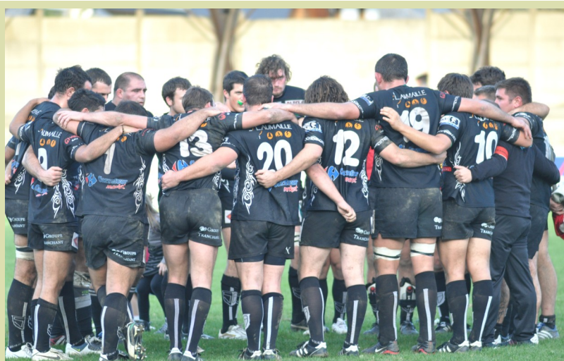
Des Noirs encore plus conquérants en 2012 c'est le vœu de SBMAG

Il faut bien l'avouer, cette année 2011 qui s'achève a été l'année du renouveau pour le Stade Bagnérais, et vous qui suivez votre Club depuis toujours, l'avez bien ressenti. Cette fin d'année est la confirmation que c'est un nouveau Stade Bagnérais qui grandit bien depuis deux saisons, arrive à maturité mais qui, ne l'oublions pas, jouait le maintien sur le dernier match de la saison 2009-2010. C'est avec le même groupe de « travailleurs du Stade », dont vous faites partie vous les supporters, que le SB se construit depuis près de trois ans maintenant et sa progression dans l'unité est évidente. Qualifiés pour les 1/16e de finale et invaincus à domicile en phase régulière la saison dernière, premier de poule une seule défaite toutes compétitions confondues à deux matchs de la fin de la série des matchs aller, Bagnères progresse continuellement avec confiance. Une fin 2011 sous le signe de la maturité et du travail. Le Stade assure, le Stade rassure et donne un sentiment exquis de fierté à ses nombreux supporters qui savourent l'instant présent.