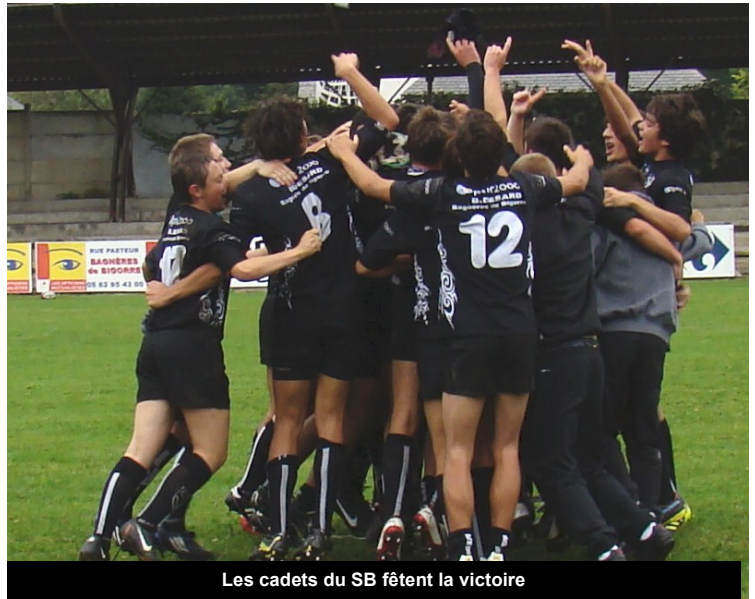
Les cadets du SB fêtent la victoire

Ndlr: A l'heure où nous mettons sous presse nous ne connaissons pas les résultats. Une courte trêve avec le championnat qui s'achève pendant laquelle les cadets et juniors ont donné le coup d'envoi d'une nouvelle compétition le Challenges Béarn-Bigorre. Premiers matchs et premières victoires des deux équipes à Bénéjacq. Prochains matchs le 17 décembre à Miélan.