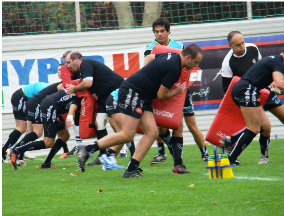
Nationale B. Un détermination qui ne doit pas faiblir

Au coup de sifflet final, les Bagnérais ont laissé éclater leur joie, tombant dans les bras des uns et des autres. Une joie bien compréhensible après une victoire qu'ils sont allés chercher. Les Noirs ont mis tous les ingrédients pour obtenir ces trois précieux points à l'extérieur. L'engagement, l'organisation, la discipline. Ces trois exigences ont été respectées et appliquées. On a eu le sentiment que le groupe s'est révélé à lui-même après cette bonne prestation. Ce match est le match référence pour la Nationale B, tout mais il faudra se souvenir pourquoi et comment on en est arrivé à cette bonne performance, comptable, sportive