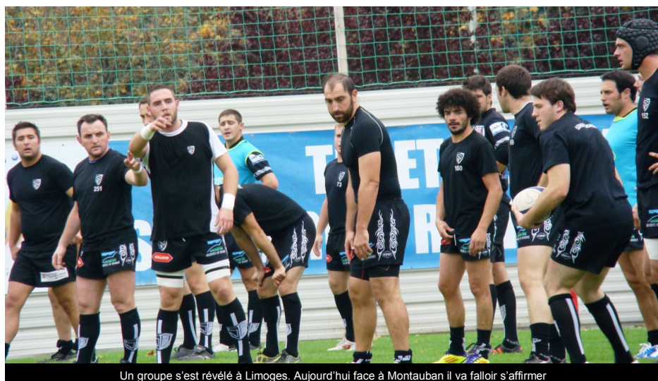
Un groupe s'est révélé à Limoges. Aujourd'hui face à Montauban il va falloir s'affirmer