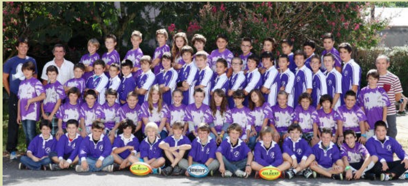
Des maillots flambants neufs pour la section rugby du Collège Blanche-Odin

Soixante quatre élèves inscrits... du jamais vu !