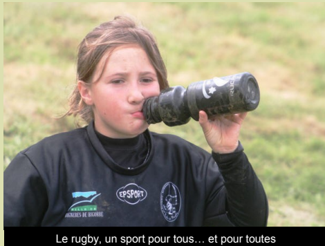
Le rugby, un sport pour tous... et pour toutes

Ils seront 170 enfants à fouler la pelouse du stade de La Plaine pour cette nouvelle saison 2012/2013. Parmi eux 30 nouveaux jeunes rugbymen en herbe viennent rejoindre l'Ecole de Rugby de l'Entente Bagnères-Baronnies sous la houlette des éducateurs prêts à leur enseigner leur sport favori. Tous les enfants âgés de 5 ans (nés en 2007) à 14 ans (nés en 1998) sont invités à venir s'inscrire. Ils trouveront à l'Ecole de Rugby le meilleur des accueils dans un esprit d'équipe, de camaraderie et de convivialité. A l'occasion du Forum des Associations, l'EDR sera en démonstration au stade Marcel Cazenave le samedi 15 septembre à partir de 13h. Pour tout renseignement, contacter Philippe Arberet (0670234497) ou Jean Claude Eleusippe (0672353545). Bonne saison à tous !