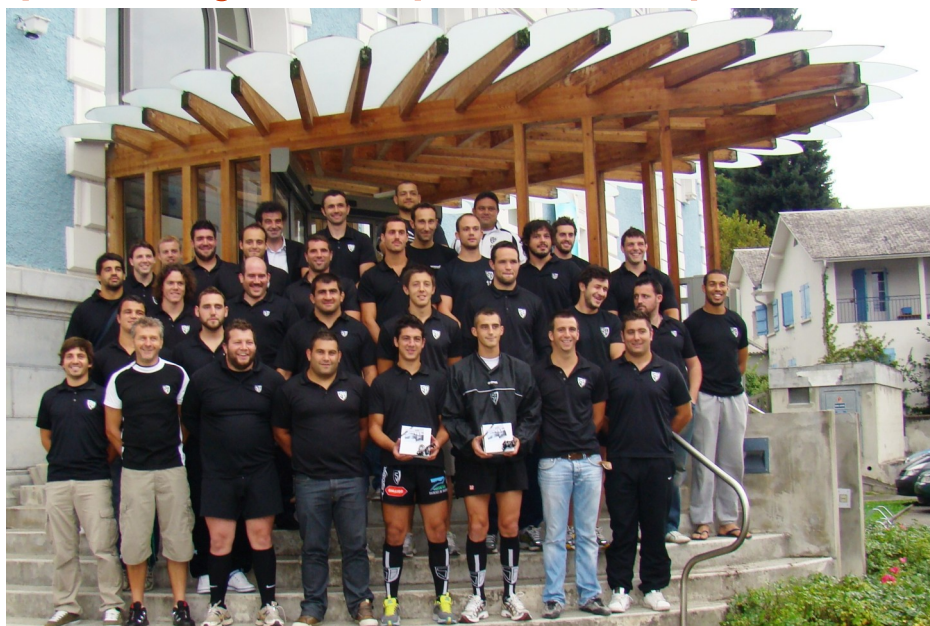
Le groupe senior sur les marches d'Aquensis