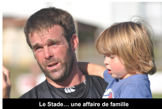
Le Stade... une affaire de famille