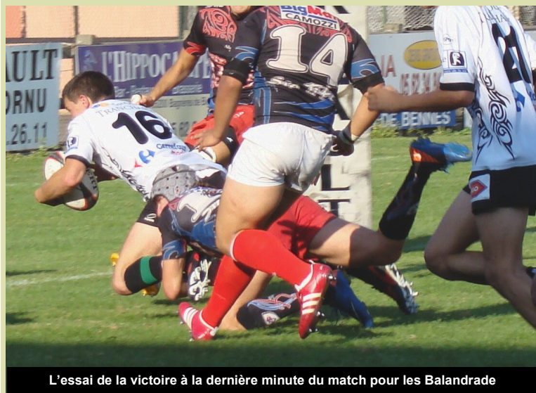
L'essai de la victoire à la dernière minute du match pour les Balandrade

toutes les infos, les photos, les commentaires sur www.stadebagnerais.com