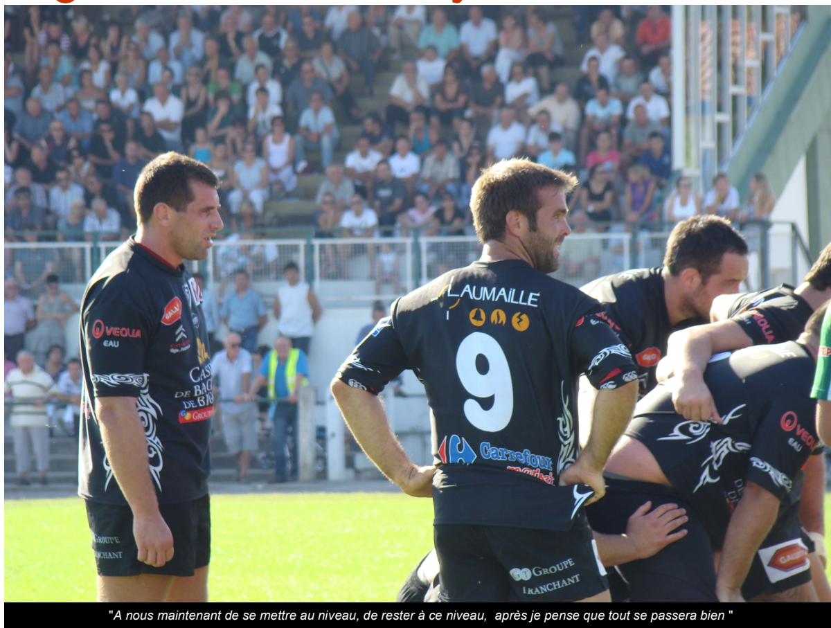
"A nous maintenant de se mettre au niveau, de rester à ce niveau, après je pense que tout se passera bien"