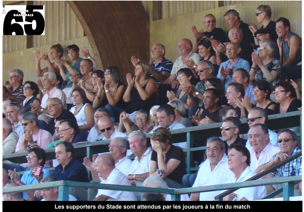
Les supporters du Stade sont attendus par les joueurs à la fin du match

Le dynamisme d l'Amicale des Joueurs du Stade Bagnérais n'est plus à démontrer. Voyages, organisation du tournoi à toucher, journées montagne, « Barathon »... et après le match c'est une fin de journée, et soirée pour les plus motivés, que les joueurs du Stade Bagnérais ont préparé pour les supporters. Tapas et