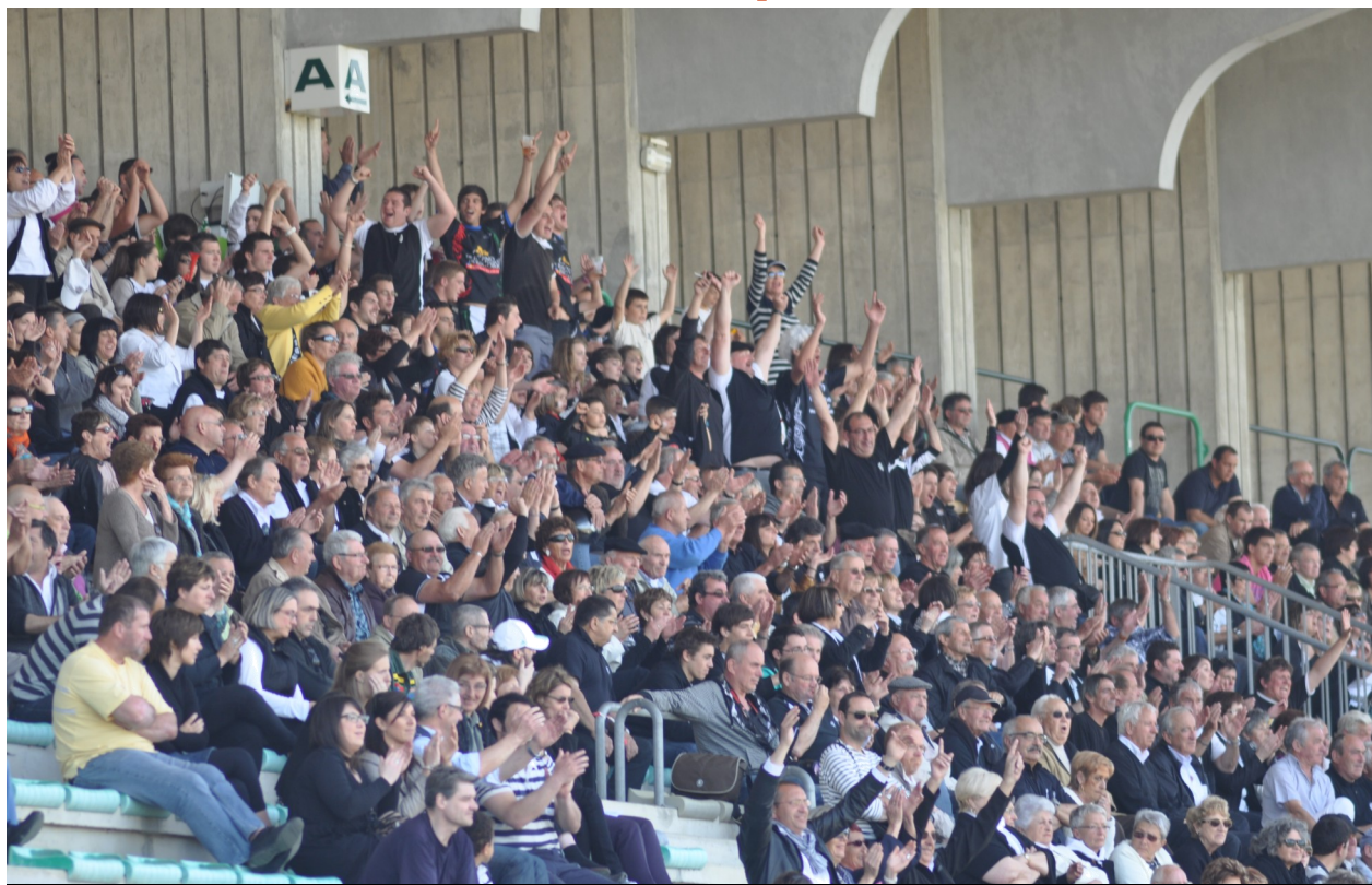
Les Bagnérais et leur formidable public rêvent de finale

1/8e Aller : Boucau 6 Bagnères 28 Feuille de match : Boucau Tarnos 6 Stade Bagnérais 28 MT : 6-22. Arbitres : M. Puharre, assisté de MM. Dassé et Guilhoure (comité Béarn). Pour Bagnères : 3 E de Simon (12e), Mur (15e), Dubarry (35e) ; 2 T (12e et 35e) et 2 P (39e et 60e) de Mur ; 1 D (75e) d'Assibat. Pour Boucau-Tarnos Stade : 2 P (21e et 37e) de Capdupuy. Cartons blancs : à Simon, de Bagnères (55e). STADE BAGNERAIS : Manse, Mur, Schneider, Forgues, Soucaze, (o) Assibat, (m) Guyon, Pène, Cossou, Ampudia, Gumez, Brua (cap.), Simon, Chaubard, Tilhac. Sont entrés en jeu : Carrère, Garcia, Junca, Déon, Arino, Jourdan, Dubarry.