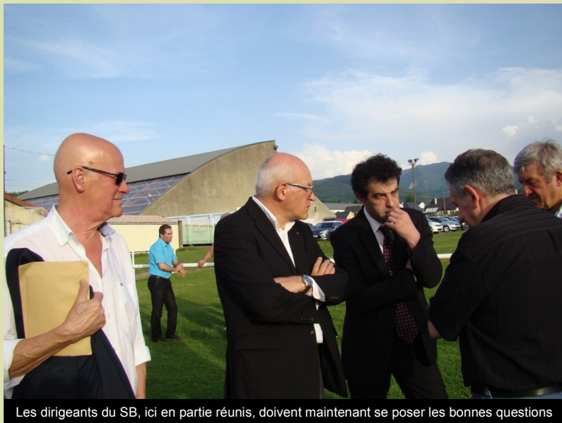
Les dirigeants du SB, ici en partie réunis, doivent maintenant se poser les bonnes questions

Une qualification en 1/4 et Bagnères est en Fédérale 1