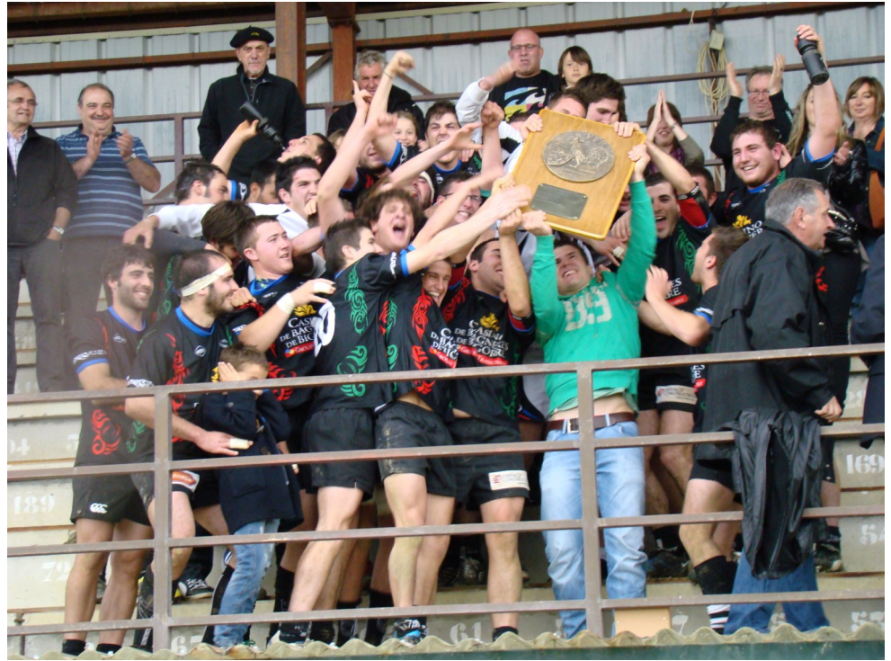
Toutes les photos sur www.stadebagnerais.com